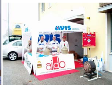
A sx e al centro: le noci del cuore con le consorelle Avis Vallenoncello e Avis Rorai Grande. A dx e sotto: la castagnata al nostro gazebo il 29 novembre 2009