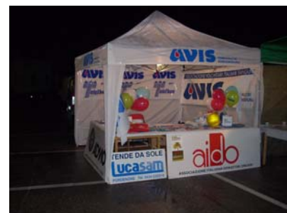
Neanche il maltempo ci ferma! Le tradizioni vanno rispettate! Eccoci al Falò